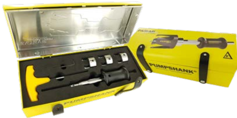
Lässt keine Wünsche offen: das Set mit PUMPSHANK® und sechs Lochsägen in den gängigen Standardmaßen.

Lochsägen Späne entstehen und kein Sägemehl. Ein sauberer Abtransport der Späne und ein damit verbundener schneller Arbeitsfortschritt sind das Ergebnis.