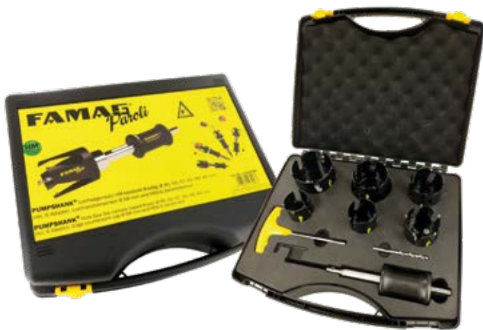
Auffällige Verpackung – im Werkzeugkasten ebenso wie in der PoS-Präsentation.