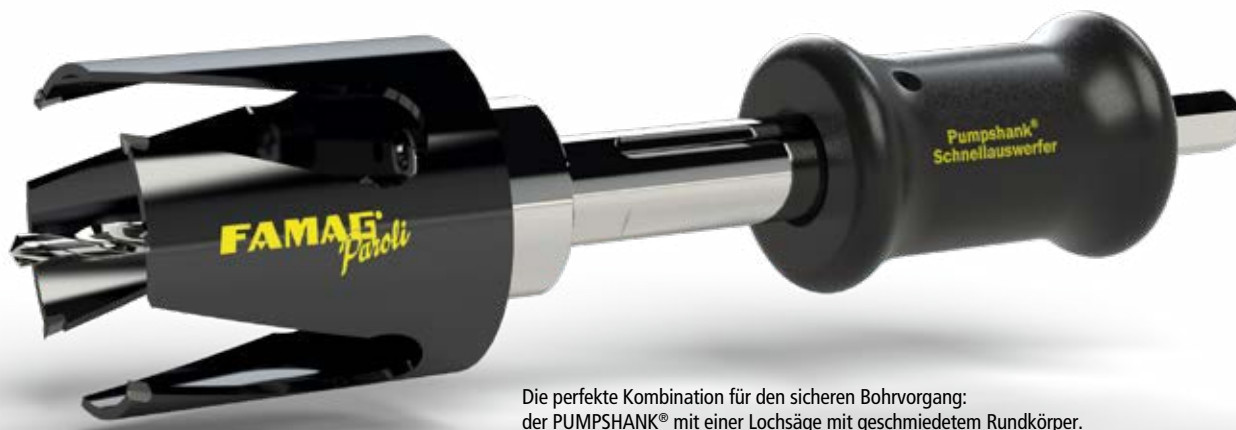
Die perfekte Kombination für den sicheren Bohrvorgang: der PUMPSHANK® mit einer Lochsäge mit geschmiedetem Rundkörper.