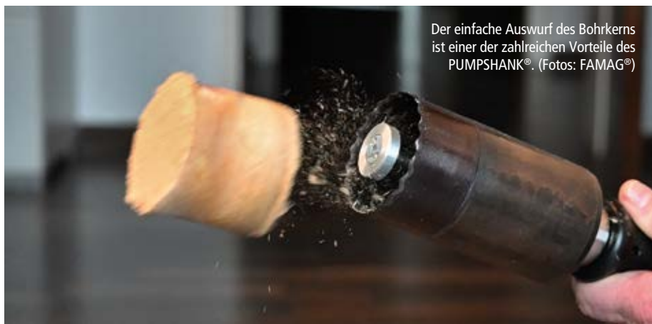
Der einfache Auswurf des Bohrkerns ist einer der zahlreichen Vorteile des PUMPSHANK®.

Die Bohrkronen der FAMAG® Lochsägen bestehen aus einem geschmiedeten Rundkörper ohne Naht oder Übergänge, der sich durch eine hohe Rundlaufgenauigkeit auszeichnet. Dieser Grundkörper wird fokussiert mit Hartmetallzähnen bestückt. In Kombination mit der nach außen schräg angeschliffenen Kontur des Bohrkörpers wird so eine vorschneidende Wirkung erzielt, die für einen sauberen Schnitt sorgt. Das zeigt sich schon daran, dass beim Arbeiten mit den FAMAG®